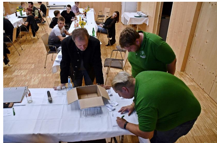
und Auszählen der Stimmzettel