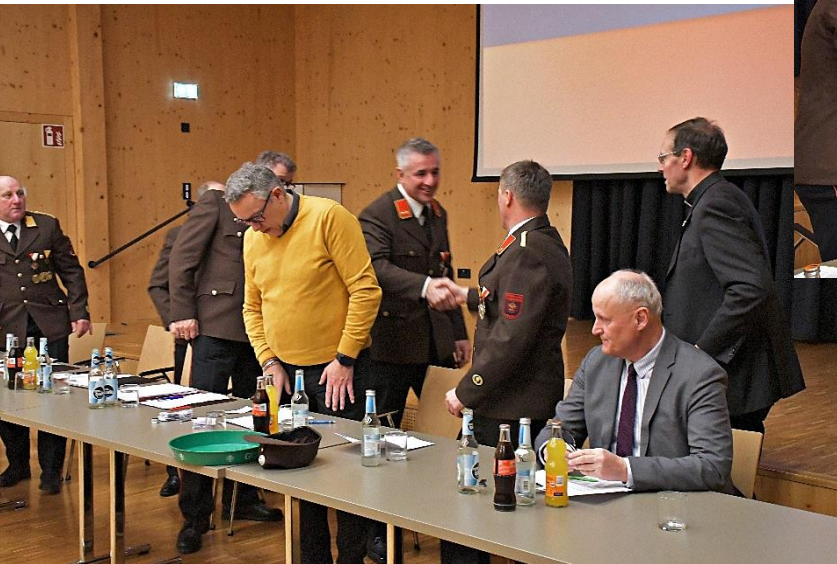
Gratulationen an die Neugewählten