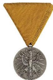
Ehrung für OBM Hannes Holzer 40 Jahre im Feuerwehr und Rettungsdienst