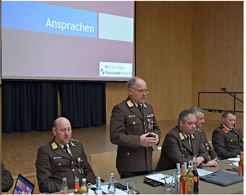
BFI Franz Brunner